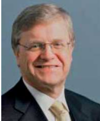
Върнер Венинг – Председател на Управителния съвет на Байер АГ